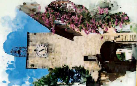
PLAN de la COMMUNE

Musée de la Truffe et du Vin ➔ Un village, deux marchés Installé dans la superbe Commanderie des Templiers, le musée présente l'essentiel de la vie de Richeranches, village itinérant du Haut Varçlaus dans l'Enclave des Papes, village de visiteurs avant que de l'industrialiser. La vendange est faite et le raisin est pressé quand commence la récolte des truffes, appelées « truffes de décembre ». À mars, Richeranches accueille le plus grand marché professionnel de la truffe auprès d'un marché de produits locaux plein à déborder.